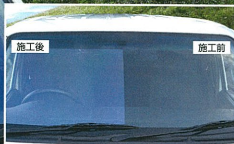
※フロントガラスに貼り付けの場合は、熱成形が必要となります。